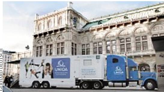
150 Personen ließen sich im Truck neben der Oper testen

den, die ihren Mitarbeitern die Möglichkeit zu einem kostenlosen Fitness-Test geben wollen. Aufbauend auf den Ergebnissen stellen die Vitalcoaches auf Wunsch ein für den Betrieb ein maßgeschneidertes Trainingsprogramm zusammen. Von Alcatel über Erste Bank bis hin zur Verbund AG reicht der Bogen der Firmen, die bisher dieses Angebot genutzt haben. Hinzu kommen die Landesregierungen von Salzburg, Tirol und Oberösterreich sowie die Wirtschaftskammern Österreich, Wien und Burgenland. Bis nach Norddeutschland und