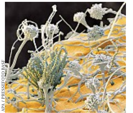
Pilzsporen gelangen tief in die Lunge

Die Experten raten bei Beschwerden jedenfalls zu einer Allergieauswertung. Für zu Hause kann auch ein Schimmeltest (um 59,90 € in Postämtern und Drogerien erhältlich), der in einem Labor untersucht wird, erste Auskunft über eine mögliche Schimmelbelastung geben. Ist sie vorhanden, seien Sanierungsmaßnahmen unumgänglich, so die Fachleute.