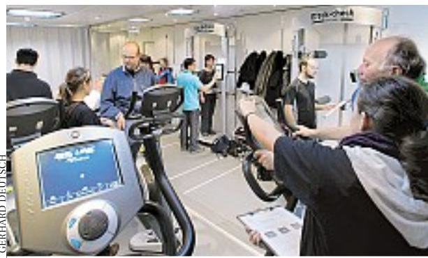
Die Teststation des LKW ist 42 Quadratmeter groß

tasten Form und Lage der Wirbel auf. – Kreislauf Abklärung mittels Stufentest. – Beweglichkeit Suche nach Einschränkungen und Muskelverkürzungen. – Rumpfkraft Computergesteuerte Analyse diverser Muskeln.